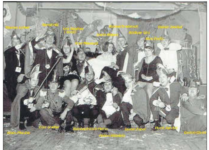
Der Elferrat 1970