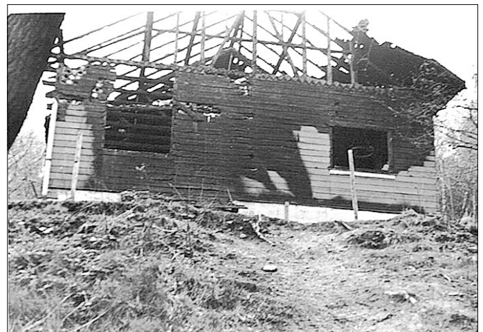
Nach dem Brand 1974