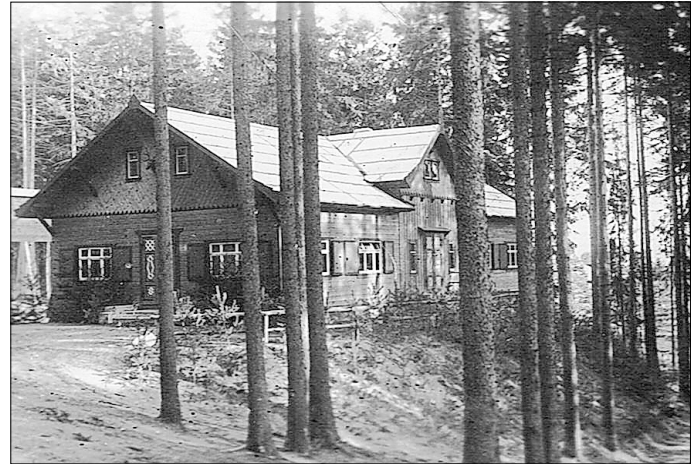
Idyllisch im Wald gelegen