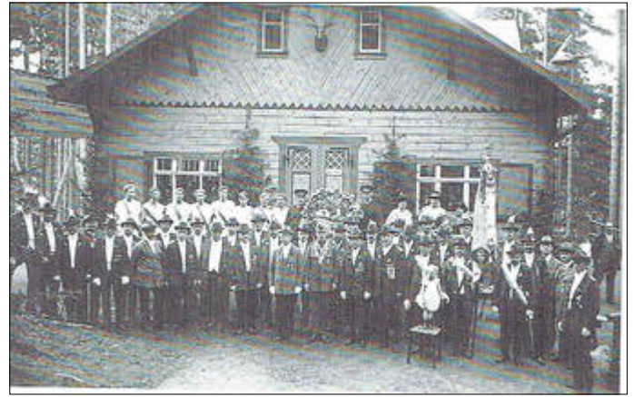
Der Georgenthaler Schützenverein

Ein verheerender Brand vernichtete im Frühjahr 1974, also vor nunmehr 50 Jahren, das aus Holz bestehende Gebäude. Der in Aussicht gestellte Wiederaufbau geriet in Vergessenheit und heute können nur Insider einige Reste erkennen.