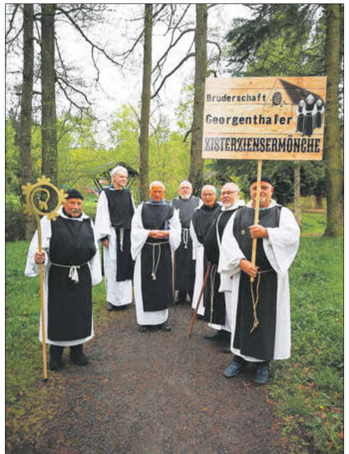
Auftritt der „Mönche vom St. Georgsberg“, 27. April 2019

Es wurde „groß“ gefeiert, mit Festzelt, mit abwechslungsreichem Programm und Veranstaltungen, die das ganze Wochenende ausfüllten, von den Organisatoren vorbereitet nach dem Motto „Nicht kleckern, sondern klotzen“. Zum Fest kamen alle Georgenthaler zusammen. Es verlieh dem Ort zudem überregionale Beachtung und die Festbesucher waren zahlreich. Bedauerlich, dass diese traditionelle Veranstaltung aus dem Ortsgeschehen von Georgenthal verschwunden ist.