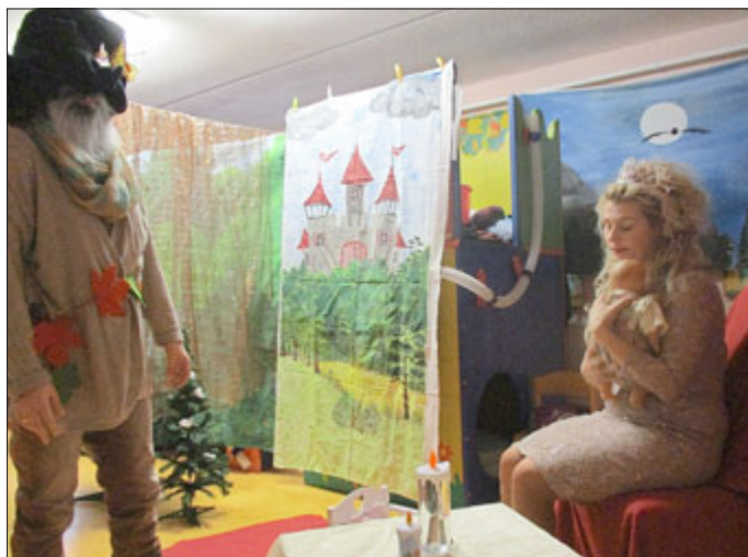
„Spatzennest“ in Altenbergen