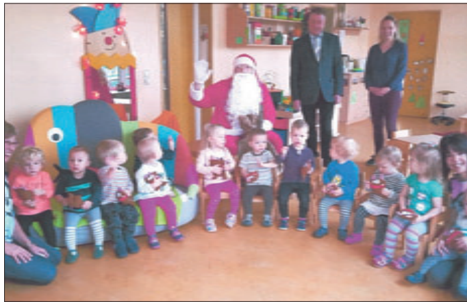
„Zwergenland“ in Leina