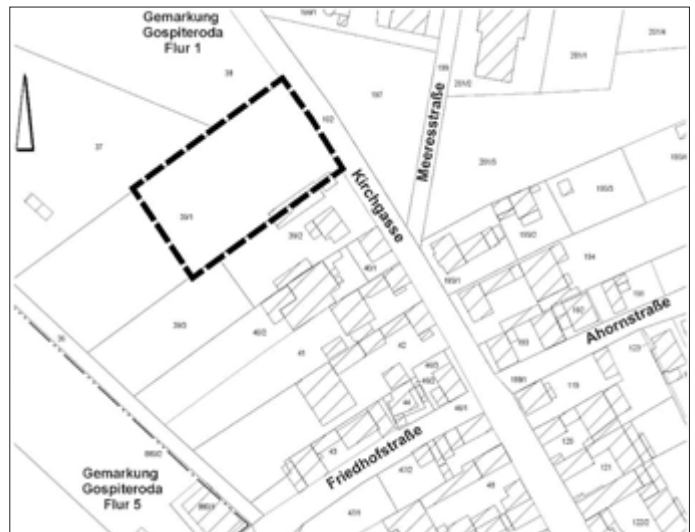
Übersichtslageplan zum Geltungsbereich der Ergänzungssatzung „Vor dem Dorfe“ im Ortsteil Gospiteroda

Übersichtslageplan zum Geltungsbereich der Ergänzungssatzung