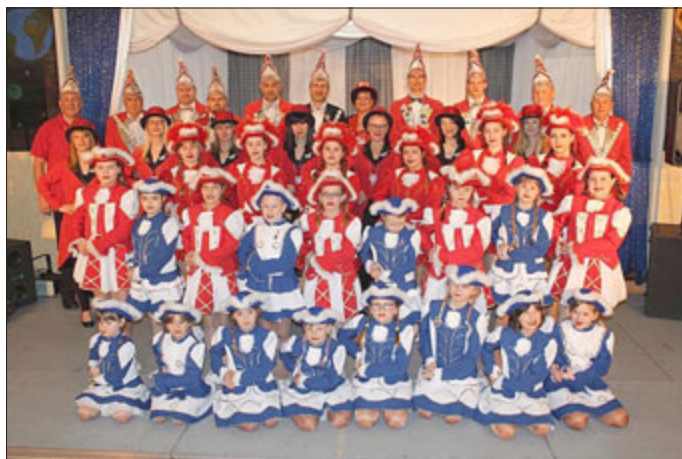
Der SVK grüßt alle herzlich!