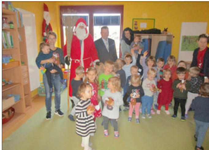
„Villa Kunterbunt“ in Schönau v. d. Walde